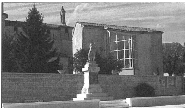
Suite rénovation par l'entreprise Marquet

Concernant l'église, il est envisagé de remplacer les fenêtres de la sacristie qui sont en très mauvais état.