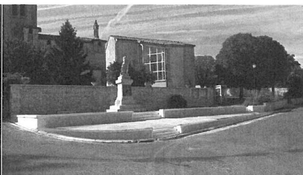
Projet d'aménagement de la placette

Le monument aux morts, remis « à neuf » par un sablage, a vu son entourage totalement modifié, avec le retrait de la haie de buis (malade) et les grilles d'entourage austères, ainsi que les quatre obus. L'entreprise Marquet de Saint-Même-Les-Carières a remarquablement remis en état le muret d'entourage et remplacé les deux escaliers d'accès (le plus petit a été offert à la commune). La placette autour du monument sera recouverte d'un film géotextile sur lequel des graviers seront déposés. La partie trottoir bénéficiera d'un muret en espalier avec un escalier d'accès disposé face à l'escalier principal. Des devis sont en cours. Ce nouvel environnement dégage le monument aux morts et le met en valeur; De plus, la visibilité au croisement de la RD75 et la rue de l'église a été améliorée. Nous n'avons pas eu de retour négatif suite à cette rénovation, nous pensons donc que ça vous convient.